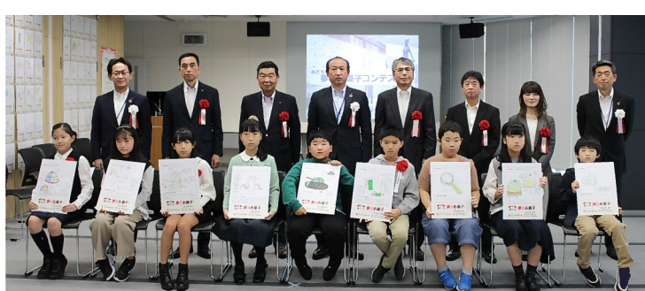
2021年度の受賞者のみなさん