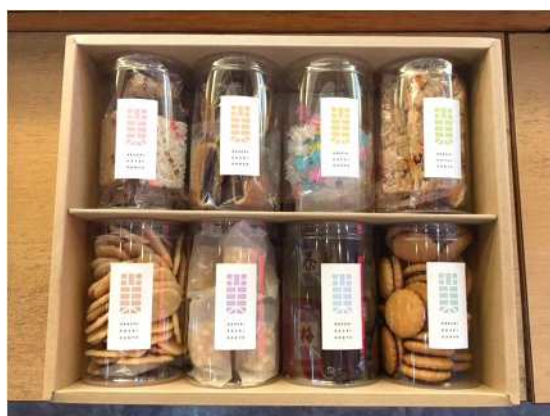
「あだち菓子本舗」による 区内製造菓子の詰め合わせ