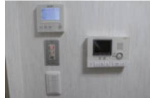
冷暖房・インターホン完備