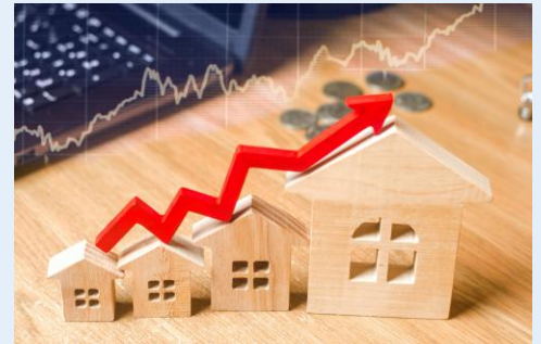
不動産賃貸料 and more...